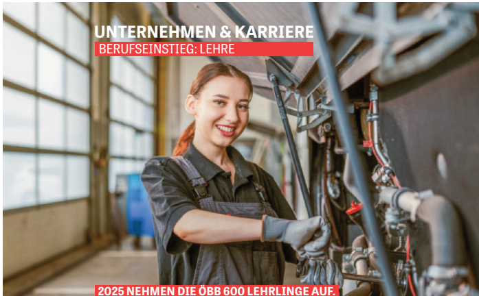
UNTERNEHMEN & KARRIERE BERUFSEINSTIEG: LEHRE