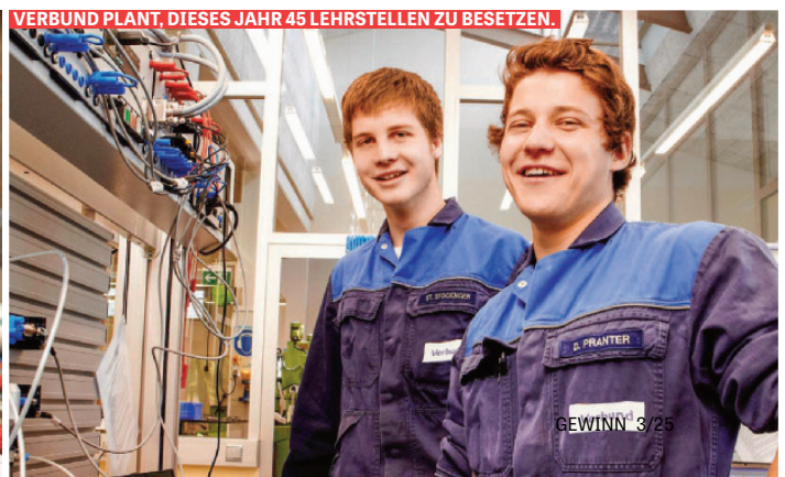
VERBUND PLANT, DIESES JAHR 45 LEHRSTELLEN ZU BESETZEN.

Gekennzeichnet: Download von Dnr-wrhBomaXfRfAkmah3U8ZdkGvllRj0N7WUkns)